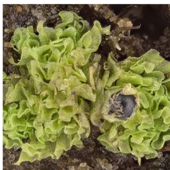
Bronior – salladslika levermossor